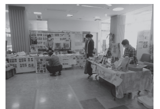
障害者福祉施設による展示販売の様子