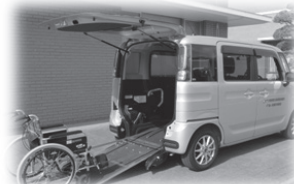
低床カー貸出事業