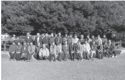
城里町・阿見町ボランティアの皆様

今後もボランティア活動を中心に、親睦の場である交流会や視察研修を通して、会員同士の情報交換やボランティア活動の促進につなげていきます。