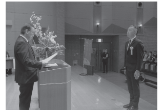
丸和バイオケミカル株式会社様への感謝状贈呈