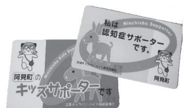
受講後、「サポーターカード」をお渡しします。