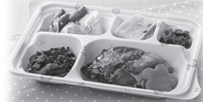
生活援助型食事サービス