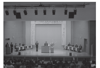
第1部 式典の部の様子